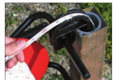
haspel support aan de peilbuis

Bij elke meter leveren wij een tapegeleider. Deze beschermt de tape tegen scherpe kanten aan de peilbuis en vergemakkelijkt het juist aflezen. Ook Geschikt als ondersteuning voor meterophanging.