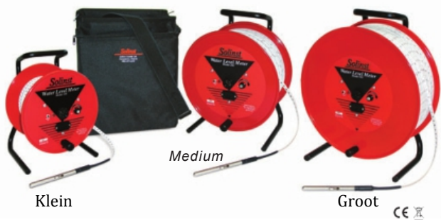
Model 101 Water Niveau Meter haspels

* PVDF laser tapes enkel in deze lengten.